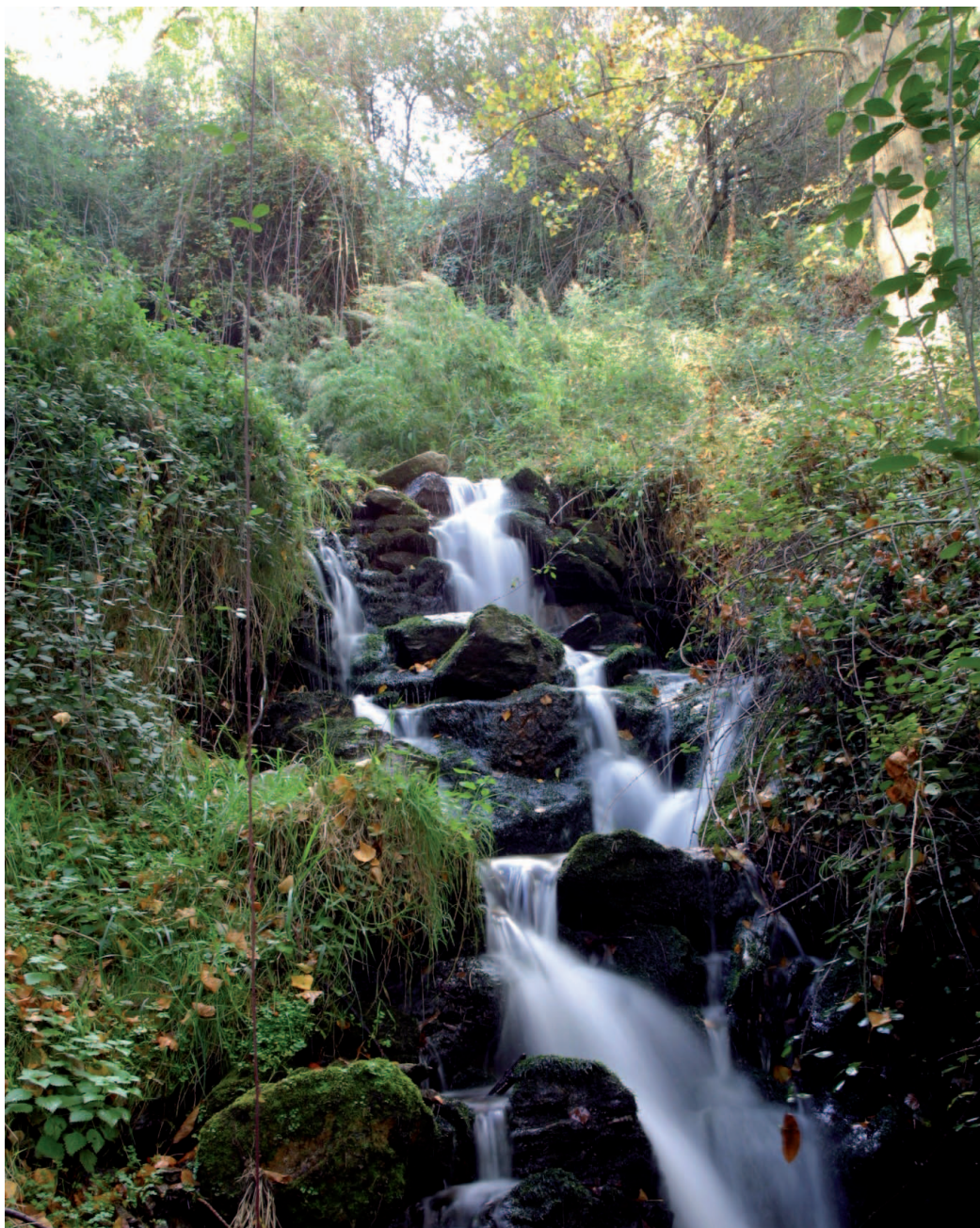
Paraje del Camino del Molino (MAN)