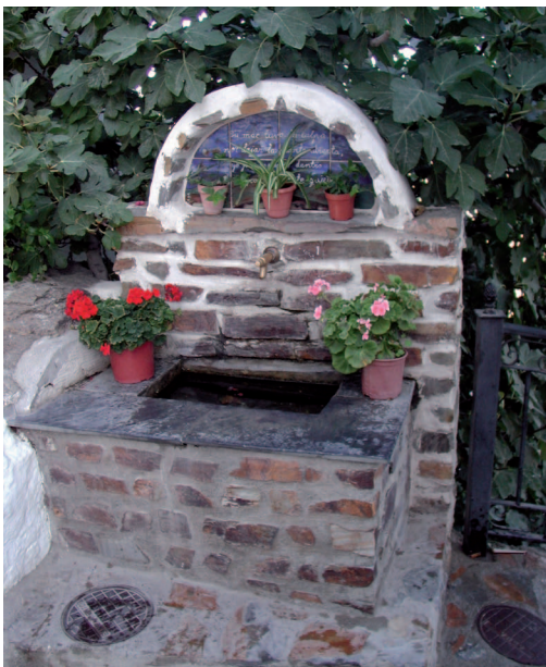
Fuente con poema en el frontón

Mirador de Las Eras: Mirador situado junto a una era de trilla de planta rectangular, enlosada con lajas. Se localiza al sur del núcleo de población.