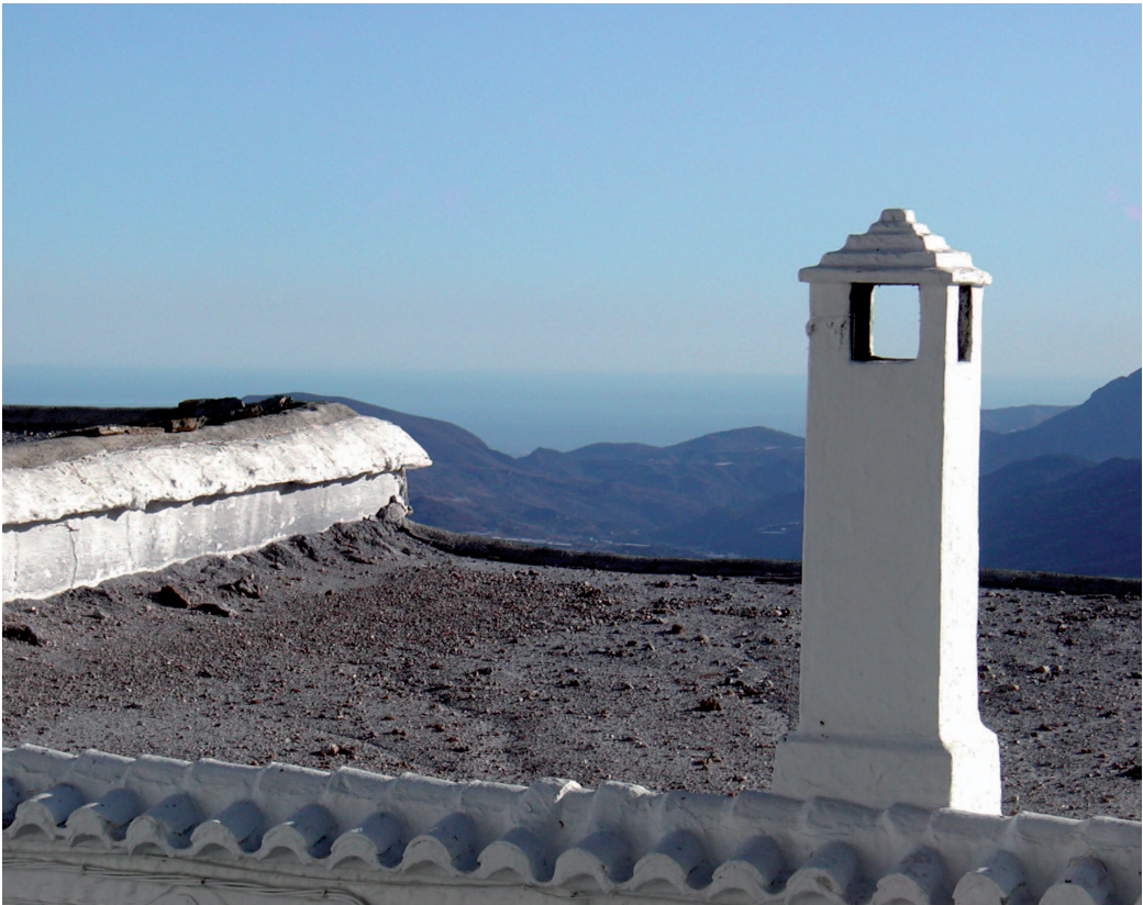
Cádiz, "mirador de África"

En el mismo edificio encontramos soluciones arquitectónicas mudéjares y barrocas.