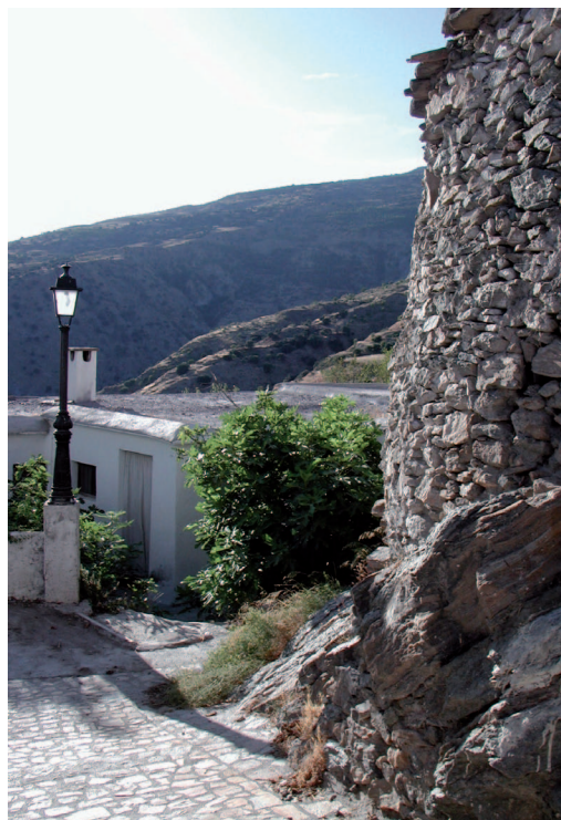
Vistas a Sierra Nevada

han cazado en el pueblo, como conejo, liebre y perdiz. Igualmente estas piezas de caza son destacadas con las buenas hortalizas que se crían en el terreno, como la fritada que se elabora con pimientos, ajos tomates, cebollas, alas que se le añade la citada carne, el bacalao o la morcilla y longaniza. El ajo blanco y sopa de almendras , muy características de la zona. Excelentes carnes de choto, cordero y vacuno se dan en el lugar de Cañar. En cuanto a la repostería destacan los roscos, pestiños y buñuelos. Otro de sus postres es el que elaboran con las castañas, con las que se hace el potaje de castañas , excelente al paladar; la leche frita ,... Hay que destacar también los vinos del terreno.