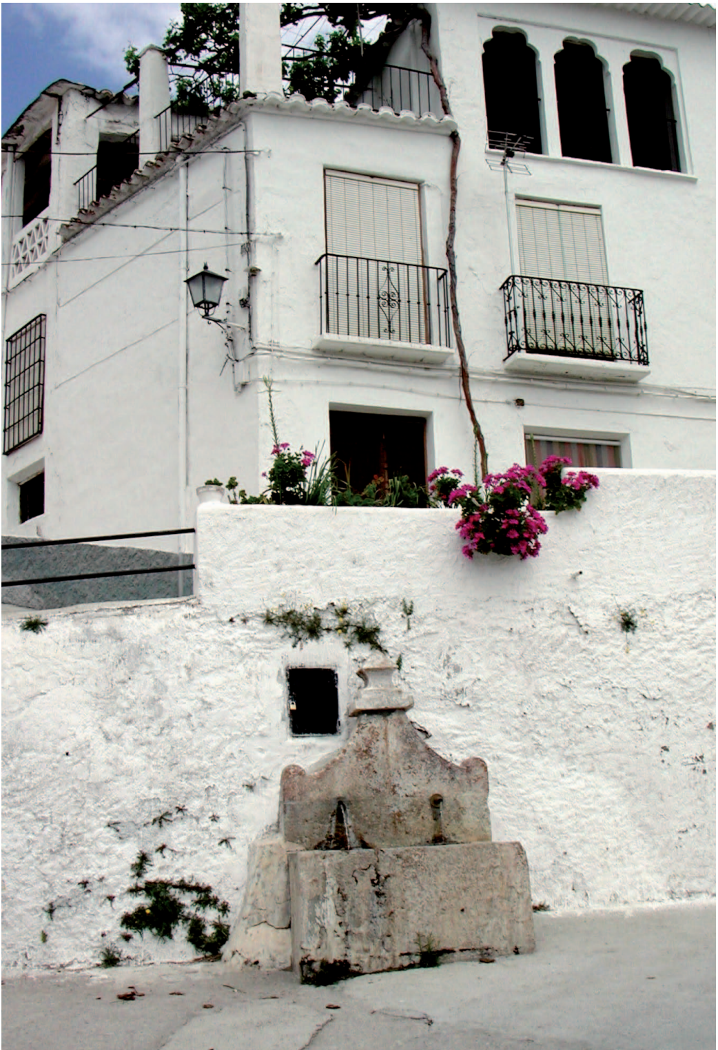
Fuente de Medina Alfahar