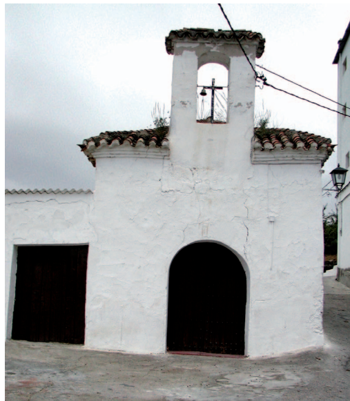
Ermita en Válor

Abén Humeya era miembro de una destacada familia morisca convertida al cristianismo tras la Conquista de Granada en 1492. Abjuró del cristianismo para recuperar la religión islámica y luchar contra la represión de la fe y las costumbres musulmanas, así como por el incumplimiento