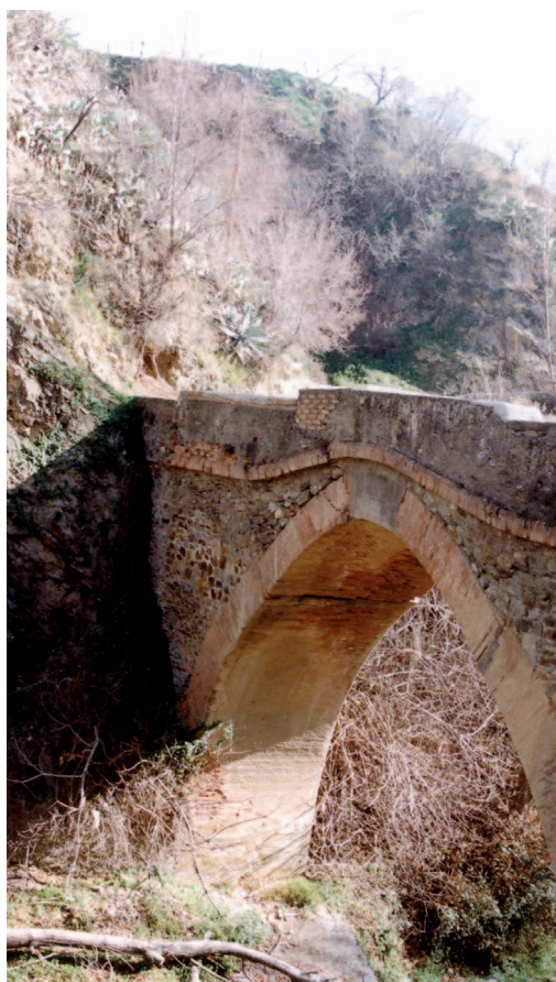
Puente de la Tableta

Lavadero de Fuente Bajuna: Hasta los años 60 del siglo XX, en que fue remodelado y adquirió su actual configuración, las mujeres lavaban arrodilladas. Bajo el lavadero aparece una pequeña balsa que recoge el agua de salida.