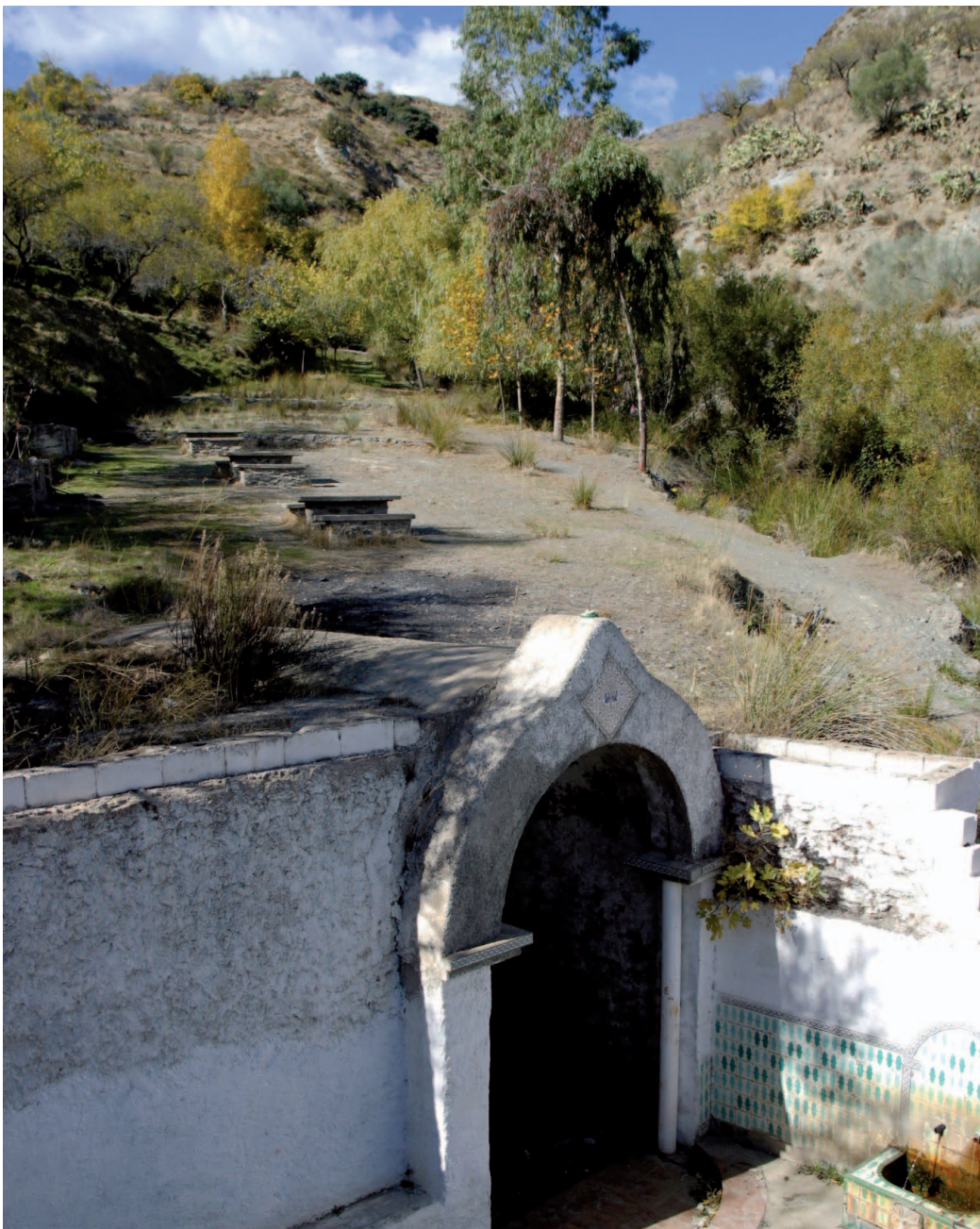
Paraje de Cuesta Viejas (MAN)