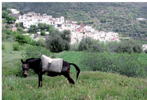
Vistas de Mecina Alfahar

sobrevive en el municipio. Con árboles frutales y palmeras de gran tamaño.