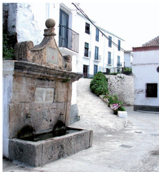
Fuente de la Plaza de la Iglesia

San Marcos: 25 de abril. Tiene lugar en Mecina Alfahar y se degustan los típicos roscos de San Marcos.