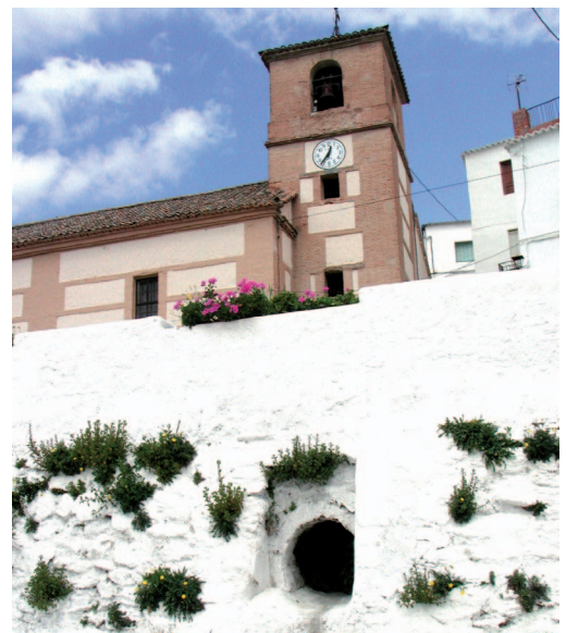
Iglesia de Mecina Alfahar

Ermita de la Virgen de Lourdes: Una de las ermitas de mayor calidad histórica y artística en la zona. En el lateral sur se encuentra adosado un pequeño cementerio. Ubicada en el núcleo de Válor.