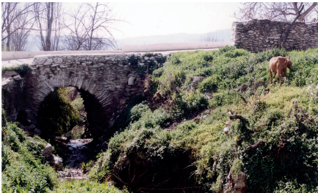
Puente medieval de Válor

Fiestas de San Cayetano: Primera quincena de agosto. Se celebran en Nechite.