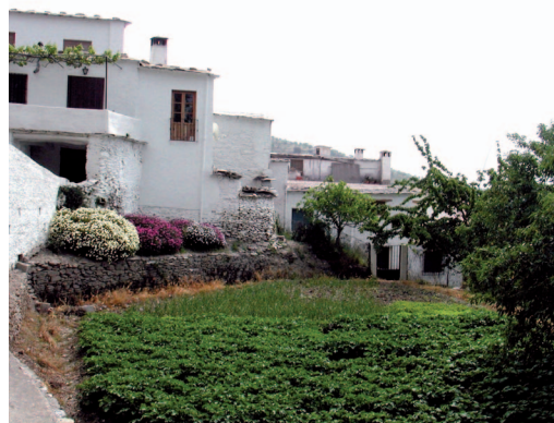
Pueblo de Nechite

Refugio de Cuatro Caminos: ubicado a 200 m de los "Cuatro Caminos", bajo la pista central o de los 2.000 metros.