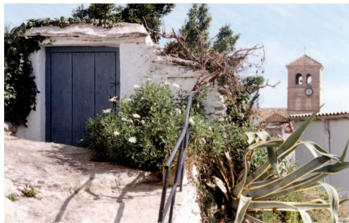
Torre de la Iglesia de Válor

Fuente de la Plaza de la Iglesia de Mecina Alfahar: Construida con piedra de cantería, posee un pilar abrevadero con frontón, del que manan dos caños. Es una de las fuentes históricas de la zona y conserva en buen estado la estructura primitiva.